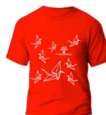
T-shirt de Origami de FUNDAPROMAT Donación mínima: $20 + envío