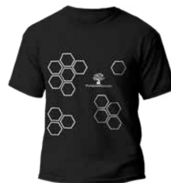
T-shirt de FUNDAPROMAT Donación mínima: $20 + envío