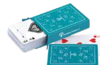
Baraja de FUNDAPROMAT Donación mínima: $35 + envío Una sola edición con 54 cartas