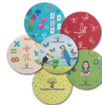
Juego de Portavasos de FUNDAPROMAT Donación mínima: $20 + envío Una sola edición con 6 portavasos

Escríbenos al correo asistente@fundapromat.org para solicitar tu pedido de nuestros artículos promocionales. Entrega disponible a nivel nacional e internacional.