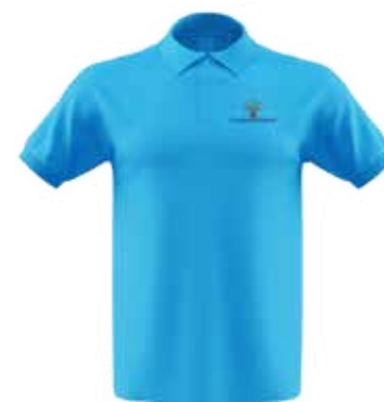
Polo de FUNDAPROMAT Donación mínima: $30 + envío