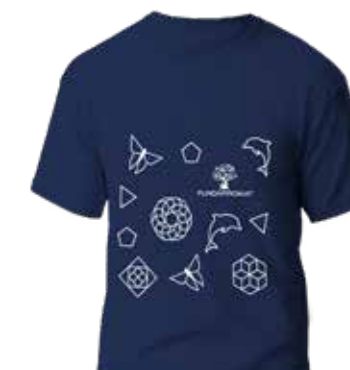
T-shirt del Carnaval de FUNDAPROMAT Donación mínima: $20 + envío