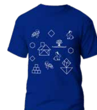
T-shirt del Jolgorio de FUNDAPROMAT Donación mínima: $20 + envío