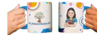
Taza de FUNDAPROMAT Donación mínima: $15 + envío