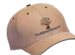
Gorra de FUNDAPROMAT Donación mínima: $20 + envío